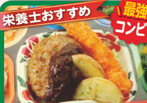
25 エビフライ&ハンバーグ 栄養士おすすめ 最強コンビ! 歩道橋の日 357kcal