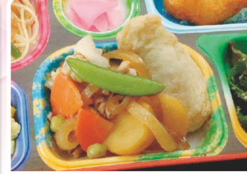
4 肉じゃが 切干大根煮 沖縄県産生魚の日 274kcal