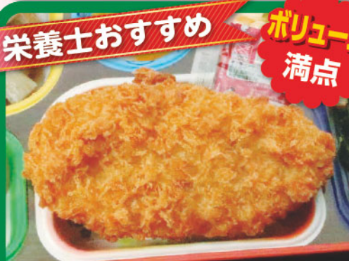
8 トンカツ マカロニサラダ 栄養士おすすめ ポリウム満点 忠犬八公の日 423kcal