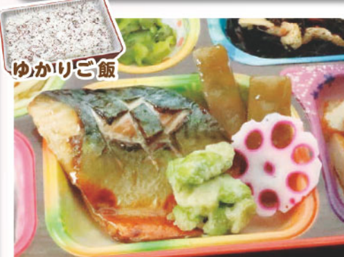
10 サバの柚庵焼き ひじき煮 ゆかりご飯 婦人参政記念日 333kcal