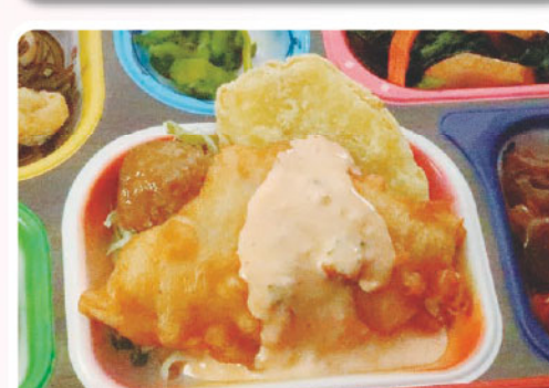
22 ホキの唐揚げ さつま芋天ぷら よい夫婦の日 383kcal