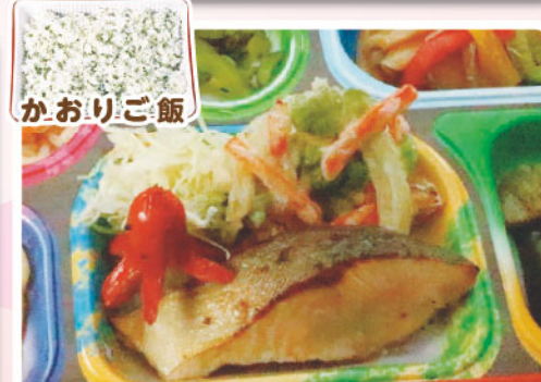
24 マスの塩焼き かき揚げ かおりご飯 植物学の日 241kcal