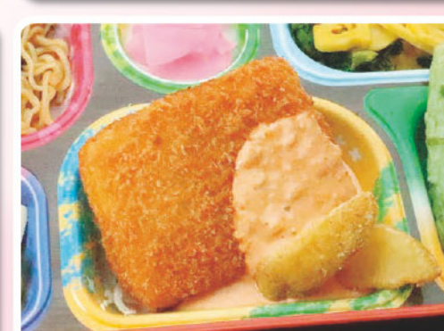
12 白身魚フライ 焼きそば パンの記念日 454kcal