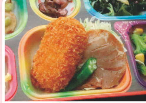
1 エビとペシャメルのコロッケ わかめの酢の物 エイプリルフール 255kcal