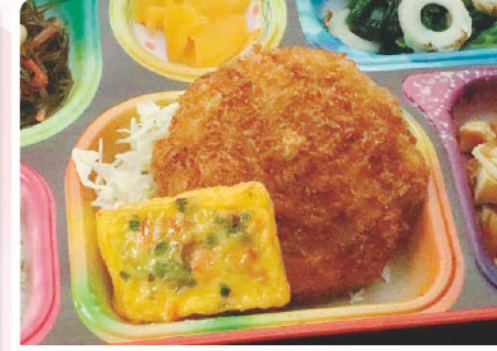
3 メンチカツ 刻み昆布煮 いんげん豆の日 395kcal