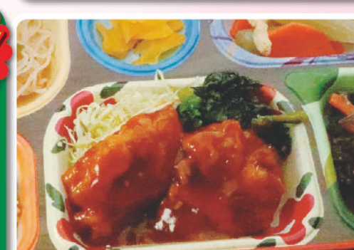
26 ヤンニョムチキン 青菜ナムル よい風の日 329kcal