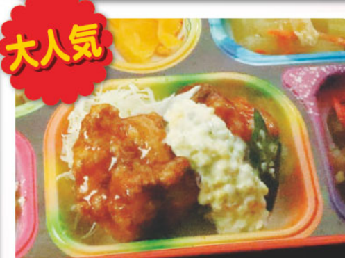
11 ミノヤ特製 チキン南蛮 大人気 メール法公布記念日 378kcal