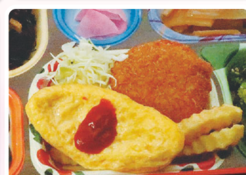
16 チーズインメンチカツ オムレツ 女子マラソンの日 312kcal