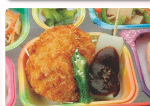
23 チキンカツ ペペロンチーノ こども読書の日 321kcal