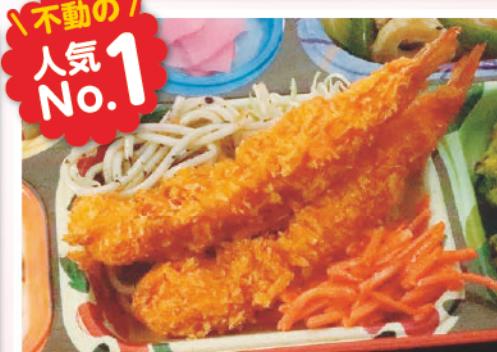
18 大人気メニュー エビフライ 不動の人気No.1 発明の日 手作りタルタルソース 329kcal