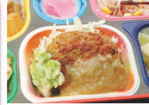
5 ハンバーグ 和風ソース ヘアカットの日 350kcal