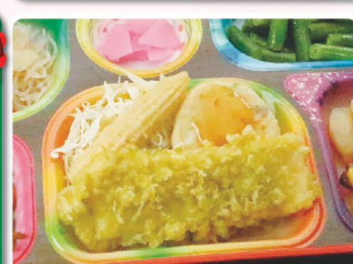
9 イカの新緑揚げ 春雨炒め 大仏の日 222kcal