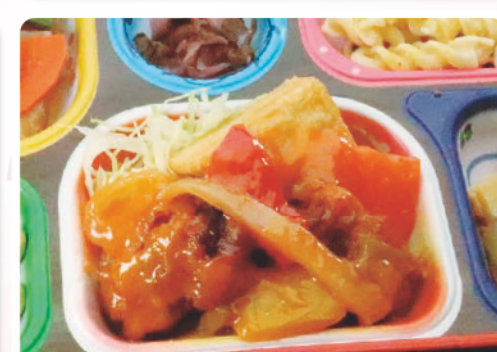
17 豚ロースのフリッター 甘酢あん 恐竜の日 283kcal