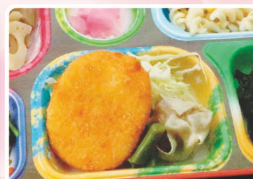
30 牛肉コロッケ 根菜煮 図書館記念日 288kcal