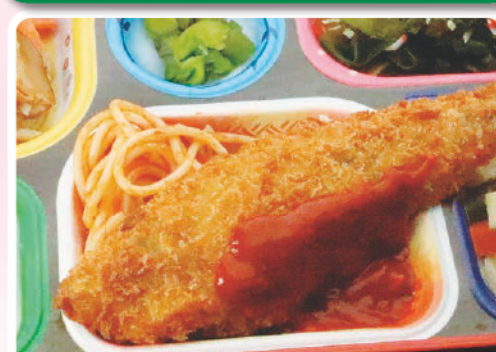
15 北海道産 マホッケフライ ヘリコプターの日 285kcal