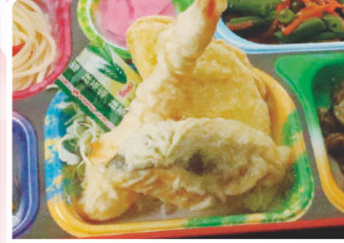
2 天ぷら盛り合わせ インゲン胡麻和え 週刊誌の日 337kcal