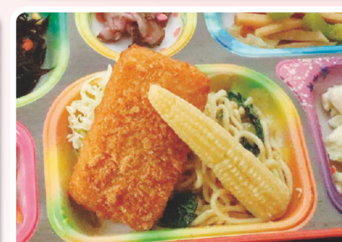
19 ハムカツ 高野豆腐煮 地図の日 345kcal